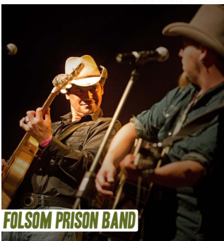
FOLSOM PRISON BAND