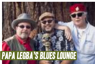
PAPA LEGBA'S BLUES LOUNGE